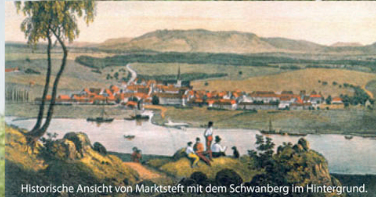
Historische Ansicht von Marktsteft mit dem Schwanberg im Hintergrund.